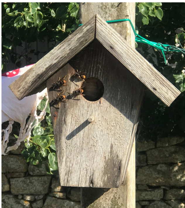
Nid secondaire à Penarguear (juillet 2019)

Lorsqu'un premier nid a été découvert en 2016 une campagne de piégeage des fondatrices a été organisée au printemps 2017. Elle a permis de piéger et de détruire une douzaine de reines et de limiter la propagation des frelons.