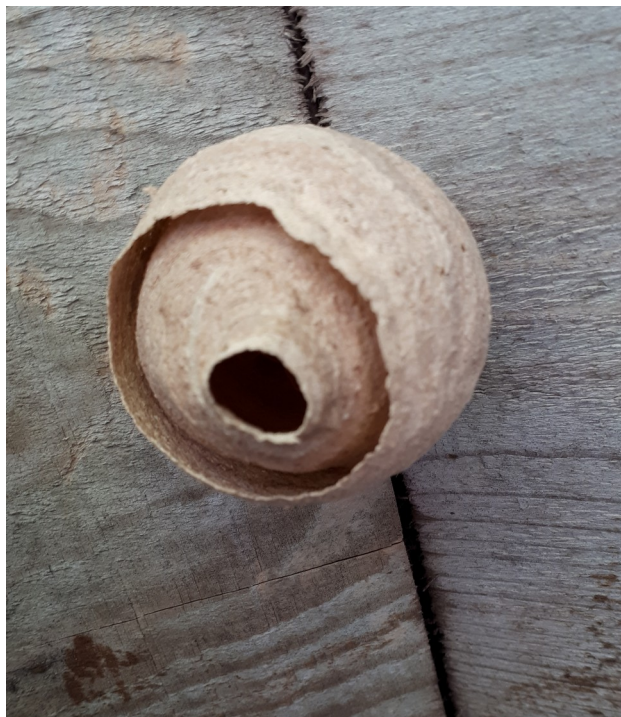
Nid primaire à Penarland (juin 2019)

En attendant tous les Ouessantins peuvent participer en détectant les nids primaires. Ce sont des petits nids qui se trouvent toujours sur du bâti (maison, crèche, encadrement de fenêtre ou de porte, avancée de toit,...).